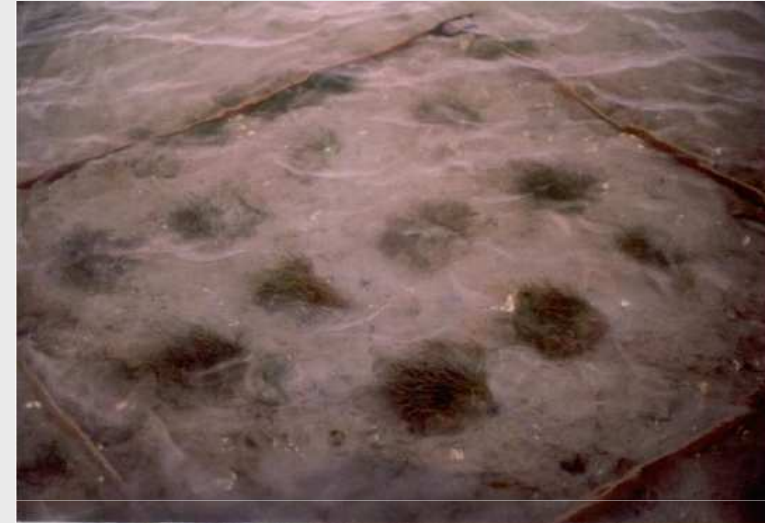
Esempi di trapianti a margine di strutture barenali