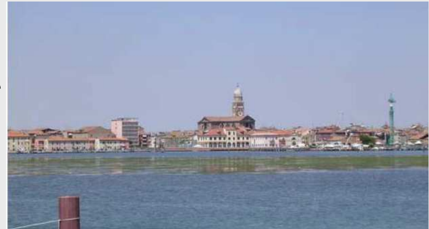
Bacino del Lusenzo interno (dragaggio e collettore subacqueo)